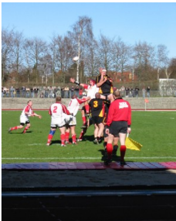
Danmark - Belgien A-landskamp den 10. april 2004